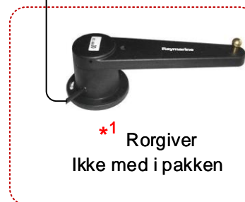
*1 Rorgiver Ikke med i pakken