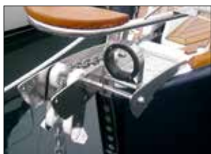
Bogbeslag integrerat med bogankarbeslag.