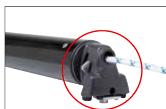
Fjäderbelastad låsning för enkel och säker hantering.