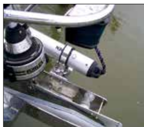
Montering på sidan av ett bogankarbeslag.